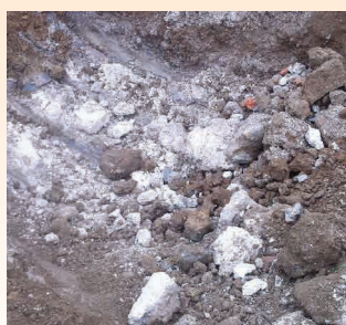
COULEUR BLANCHE PRESENCE DE PLATRE POSSIBLE