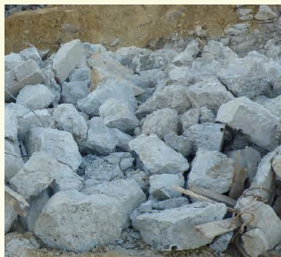
BETON, BETONS FERRAILLES *17 01 01