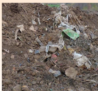
PRESENCE DE PLASTIQUES, MATERIAUX ISOLANTS...