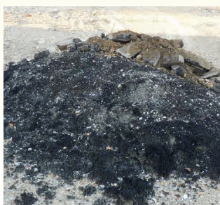
ENROBES *17 03 02