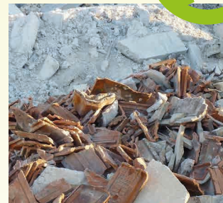
MELANGE DE BETON, BRIQUES, TUILES... *17 01 07