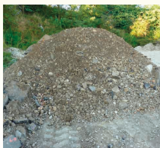
DEBLAIS, TERRES, PIERRES DE TERRASSEMENT *17 05 04 - *20 02 02, STERILES, SABLES ET ARGILES DE CARRIERES *01 03 06 - *01 04 08 - *01 04 09