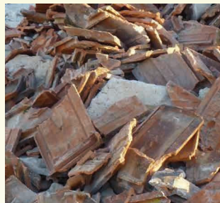
TUILES ET CERAMIQUES *17 01 03