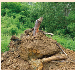
PRESENCE DE BOIS