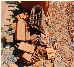
BRIQUES *17 01 02